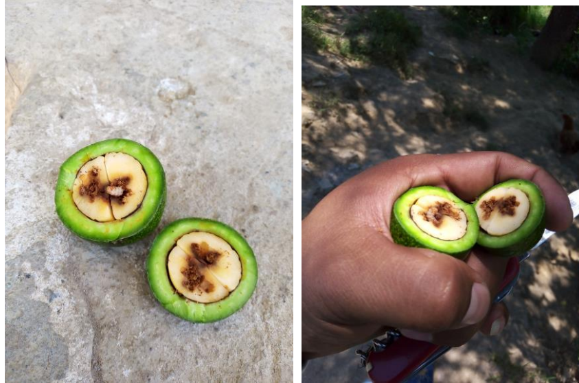
Figura 4. Acción de control focos de infestación de barrenador de hueso en el Municipio de Atlixco.