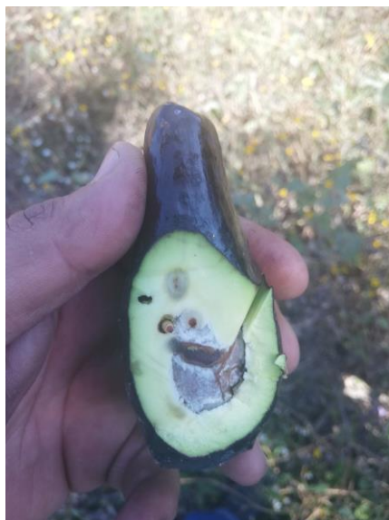
Figura 1 Daño por Barrenadores del Hueso

En el año 2020, personal técnico de la campaña fitosanitaria realizó los muestreos para la detección de barrenadores del hueso (Figura 1) en una superficie acumulada de 9,035.99 hectáreas y en 3,057.47 hectáreas para barrenador de las ramas. Se llevó a cabo el control de focos de infestación de barrenadores del hueso en 532 predios, con actividades de aplicación foliar y recolección y destrucción de frutos, y en 115 predios para barrenador de las ramas con acciones de aplicación foliar, censo y podas. Así mismo, se realizaron la instalación de 29 trampas tipo ala para palomilla barrenadora con 357 revisiones. Se impartió 49 pláticas dirigidas a productores, y se realizaron supervisiones de campo a personal técnico de la campaña. En el año 2020 se alcanzó un porcentaje de infestación promedio para barrenadores del hueso del 7.94% y de 1.85% para barrenador de las ramas.